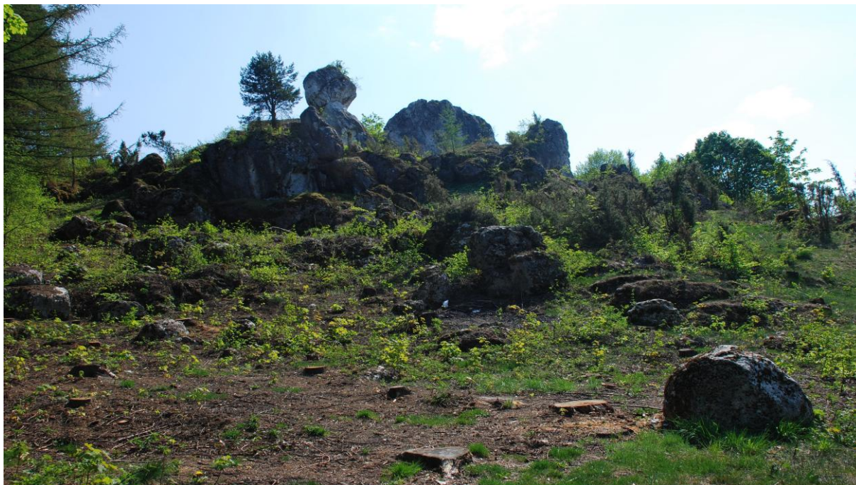
Przykład ochrony czynnej – odsłonięty maszyn skałkowy w okolicach Trzebniowa - wzgórze zwane Końskim Łbem. Odradzająca się roślinność naskalna.