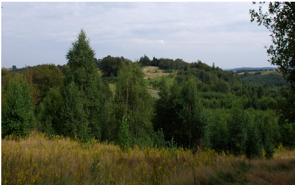
Okolice Góry Leszczynowej. Zarastające wskutek naturalnej sukcesji nieużytkowane łąki.