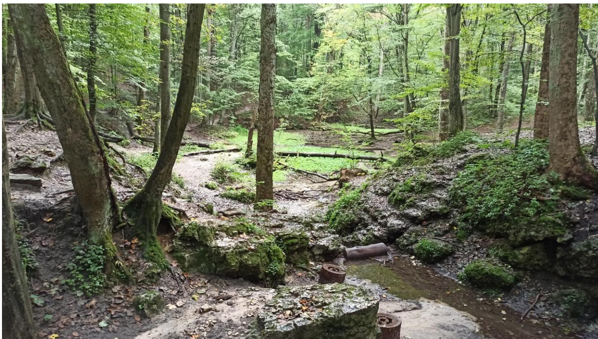
ZDJĘCIE NR 3

Źródła Wiercicy typu szczelinowego (źródło Zygmunta). Centralna część rezerwatu Parkowe z unikatowym zbiorowiskiem buczyny na stokach wapiennych wzgórz otaczających dolinę.