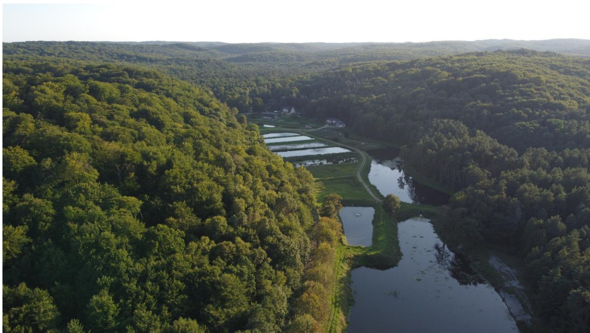
Zespół stawów hodowlanych na Wiercicy. Widok od strony północnej