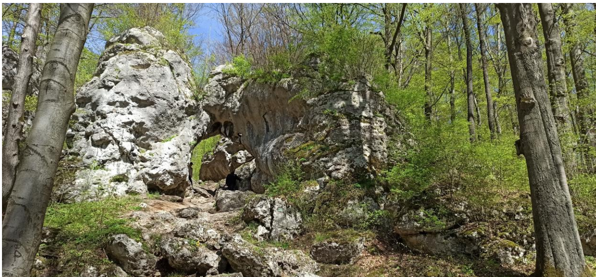
ZDJĘCIE NR 4

Ostaniec skalny nazwany Bramą Twardowskiego. Bogate walory fizjonomiczne. Jeden z symboli krajobrazu Wyżyny Częstochowskiej.